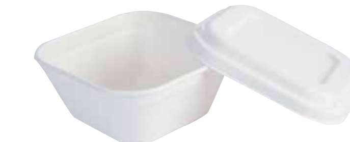
NAT. BIO 0086 138x138 mm h 58 mm 450 pz/cart (50x9) NAT. BIO 0086L coperchio/lid/Deckel 450 pz/cart (50x9)