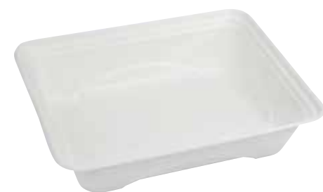
NAT. BIO 13101 250x330 mm h 75 mm 1 comparto/1-teilig 200 pz/cart (25x8)