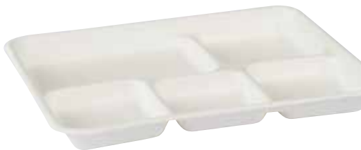
NAT.BIO 0510 265 x 210 mm - h 22 mm 500 pz/cart (50x10) 500 Stück/Karton