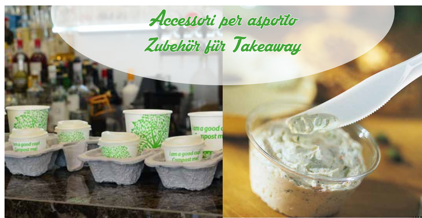
Portabicchieri a 4 posti (2+2) in polpa di cellulosa naturale Cup holder 4 hole Getränkehalter für bis zu 4 Becher (2+2) aus natürlichem Zellstoff