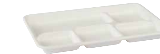
NAT.BIO 0512 320 x 230 mm - h 24 mm 500 pz/cart (50x10) 500 Stück/Karton