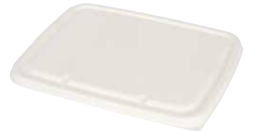
NAT.BIO T053 286x225x14,5 mm 400 pz/cart (50x8) 400 Stück/Karton