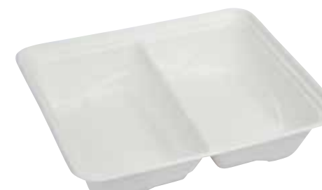
NAT. BIO 13102 250x330 mm h 75 mm 2 comparti/2-teilig 200 pz/cart (25x8)