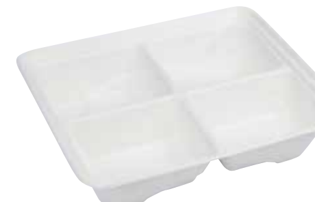
NAT.BIO 13104 250x330 mm h 75 mm 4 comparti/4-teilig 200 pz/cart (25x8)