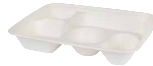
NAT.BIO T052 282x220x37,5 mm 400 pz/cart (50x8) 400 Stück/Karton