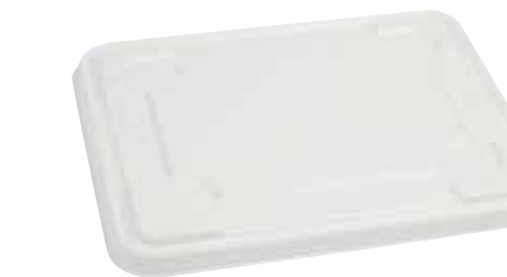
NAT. BIO 1310L coperchio/lid/Deckel 200 pz/cart (25x8)