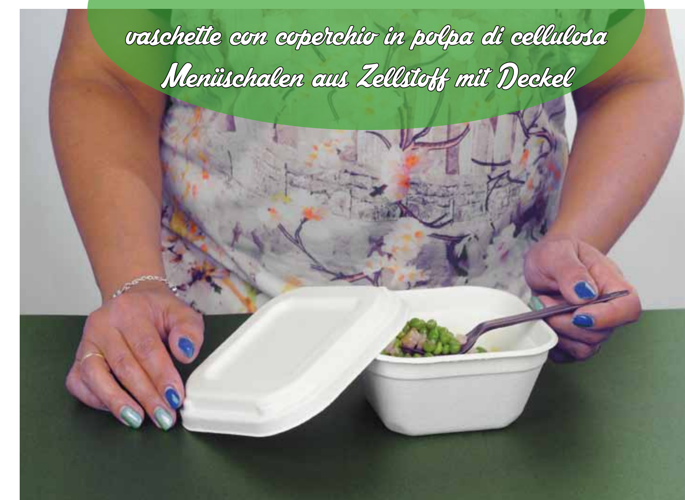
Vaschetta quadrata Square bowl Schale quadratisch