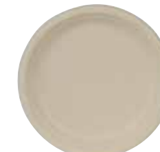
NAT.BIO B005 ø 230 mm h 20 mm 500 pz/cart (50x10) 500 Stück/Karton