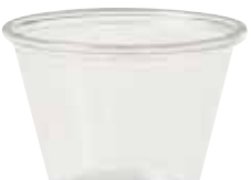
NAT.PLA-T400 118 ml - 4 oz. 2000 pz/cart (100x20)